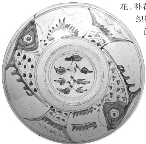
图 19 青花双鱼纹盘(山东)

民间美术是忠实于这一基本原则的。劳动者把生命维系过程与艺术创作直接沟通，并作为联系生活的主要方式，因此上，它的生产创造遍及生活的每一个角落，从日常生活用品、劳动工具，到生老病死、四时八节的节令方物，应有尽有。衣饰穿戴方面，如五十多个民族的不同服装、服饰，不同个性的挑花、绣花、补花，不同风格的蓝印花布、彩印花布、蜡染、织锦，各种童帽、童鞋、刺绣小品与少数民族的银首饰等；日常饮食器具方面，如各地的陶瓷器、青花鱼盘、砂器等，木制竹制的筐、篮、篓、笠、席、垫、笼等各种材料的编织物以及伞、扇、杖等；作为节令方物的，从正月初一到大年除夕，有城乡普遍使用的年画、春联、斗方、门笺、泥塑、泥玩，各种灯彩、彩粽艾虎、五色丝缕、瑞饼果