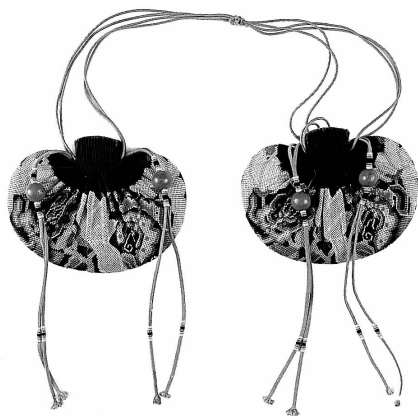
图 30 纳纱香囊 (北京)

正像民俗自身的某些特征和传承方式一样,民间美术也具有相当强的稳定性或保守性。民间美术是民俗文化的载体和组成部分,它直接反映了民众的精神追求和思想感情;如果缺乏对民俗的了解,就很难理解民间美术的表现形式与内容,也就无从掌握它的演变规律。