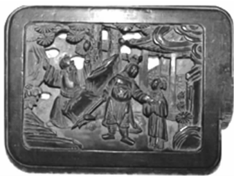
图 34 木雕戏曲 “凤仪亭”镶板(江 苏南京)

一位外国的戏剧理论家曾经讲过这样一句话:“没有观众,就没有戏剧。”观众之于戏剧可以说是戏剧界研究的一项重要课题。观众从来都不是被动地接受戏曲演员的表演,而是积极参与戏曲的创造。他们除去在剧场与演员交流,共同塑造成功的角色外,还同时以其他方式表达他们对戏曲、戏曲人物和演员的欣赏与再创造。中国戏曲源自民间。民间观众,主要是农民、市民