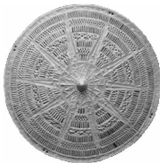
图 29 太阳纹镂空花顶盖(云南)