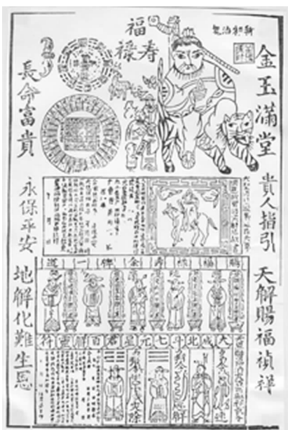
图 24 木版墨印 平安灵符(广东)

中国的传统宗教主要是佛教、道教和民间流传的原始信仰。在民间美术中时常有原始信仰痕迹的流露,但它往往已蜕变为一种禳灾辟邪、祈求吉祥的程式化的象征形式。民间美术在宗教活动中的作用,如同其他宗教艺术一样,是为宣扬宗教思想服务的。自古至今,木偶皮影都有流传于寺院的经历。唐代寺院中的俗讲僧,在讲演时就曾使用影人做超度亡者灵魂的佛事。自宋代开始,福建漳州、泉州民间,每逢迎神祭祀、菩萨生日,都要在神庙中演出木偶戏。至今木偶戏仍承担着筑院谢土、建庙制煞、镇压(水、火)灾星、开社除祟等宗教职能,并有一套戏巫合一的演出程式。如“祭拜天公”,由木偶扮演的道士读榜请神、念咒画符、点演、巡回驱邪、踏七星罡步、安八卦图等,戏巫并施,气氛极为恐怖。每年农历七八月间,集市上还出售象征性的纸扎提线木偶和掌中木偶,以应人们用来焚化普度亡魂和敬鬼神的习俗。在四川北部的广元、仪陇、绵阳地