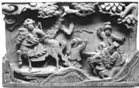
图 31 砖雕戏曲人物(江苏苏州)

宋代以来,戏曲逐渐成为民间社会生活中最为普及的一种艺术活动。在我国城乡地区至今仍有大约三百多个剧种在演出,上演的剧目更是相当丰富。这些戏曲抒发了人们对英雄人物的敬仰之情,也表达了人们对善恶美丑的判断,寄托了人们对幸福自由的向往与追求。民间艺人将戏曲中人们所喜爱和熟悉的人物形象与剧情场景,经过巧妙的艺术处理后创作成不同样式的民间美术品。这些民间美术品伴随着人们的日常生活进入千家万户,从而使戏曲得以在更广阔的空间里流传。长期以来,中国的民间美术与戏曲在相互影响、相互促进的发展过程中,形成了一种极为特殊的关系。深入了解和认识这种关系,就会发现,其实民间