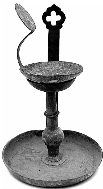
图 37 铜质两用油灯(云南)

人们对器物的最基本的要求是既能够便利生活，又能够美化和丰富生活。在不同的社会环境、生产方式、经济结构条件下的工艺生产的目的地和社会功用显然也是不同的。不同的需要导致了人们在造物活动中创造的多元化。人的需要是不断地发展和变化着的，当原有的需求得到满足后，便会激发出新的需求来，不断的需求是人们造物活动不断发展的动力。民间美术作为广大劳动者生活文化的一部分，在任何一个有劳动群众的地方，都能听到它脉搏跳动的声音，它的特点决定了它在整个美术范畴中的主体地位。可以说，从人类的早期社会开始，民间美术便广泛地扎根在人们的生活之中。在中国，封建社会