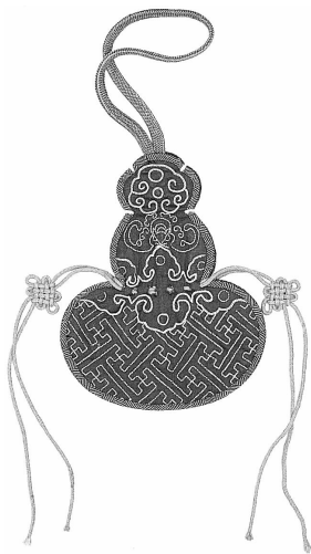
图 36 蓝缎地缉 针绣“万花阵”烟荷 包(山西)

腔、老腔、弦板腔、眉户戏和各种道情戏等。陕西民间剪纸以陕北的定边、靖边、吴堡、榆林、宜川、延安，关中的凤翔、富平、朝邑，以及汉中和渭南地区较为丰富。窗花，是陕西剪纸应用最多的一种形式。戏曲人物造型生动，线条细致流畅，多用镂空和阳刻手法，受皮影造型影响较大。陕北地区戏曲剪纸风格粗犷、朴实，汉中地区则显得工巧、细致。陕西有句民谚：“生女子要巧的，石榴牡丹冒较的。”在关中周至山区，正月十六这天村民们自然相聚，成群结队“看窗子”，民谚称“一看窗子，二看帘，三看媳妇蛮不蛮”。说的是以剪纸技艺的高低来评说媳妇女子的巧拙，心灵手巧的妇女们就能够用精美的戏曲窗花来展现自己的聪明才智。