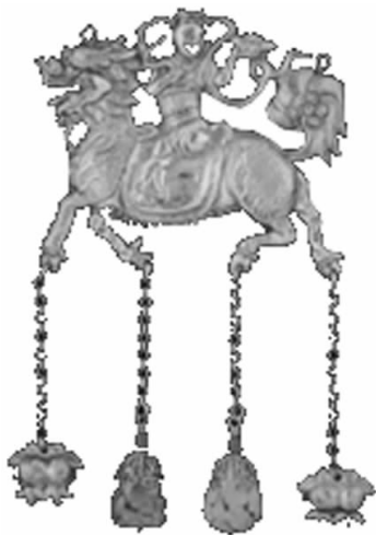
图 23 银“麒麟送子”挂件(北京)

为宗教场所、宗教仪式服务的和宣传宗教思想的美术活动及作品，既是美术的组成部分，又是宗教文化的组成部分。中国的宗教美术主要是指佛教美术和道教美术，尤其是佛教美术曾在魏晋隋唐时期达到高峰。宗教美术对中国民间美术曾产生过相当强的影响。在中国数千年的历史中，宗教与民间信仰非常活跃，也相当复杂。宗教作为一种历史的社会现象，渗透到社会生活的方方面面。民间美术与宗教文化的关系，不仅体现在它所表现的宗教故事、宗教人物、宗教思想及宗教活动上，也体现在它自身形成的历史过程中。