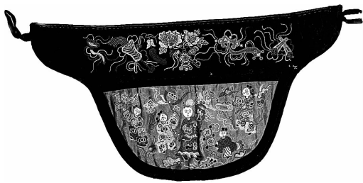
图 33 红缎地打子绣“五子夺魁”抱肚荷包(内蒙古)