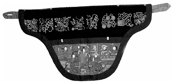
图 32 红缎地打子拉锁子“宇宙锋”抱肚荷包(内蒙古)

纸也在宋代同时出现,其中最特色的当数“灯花”。灯花亦称“灯笼花”,是指装饰在灯笼上的剪纸。过去,人们日常生活照明或节日喜庆装点,都要糊制各种样式的灯笼;为了使其美观好看,人们又常以彩纸剪成各种花样贴在上面。宋代灯品名目繁多,装饰剪纸最多的要属走马灯,用的剪纸多为戏曲刀马人物。走马灯是利用热气上升的原理,以烛火推动纸轮旋