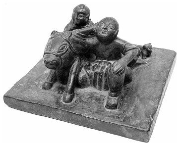
图 27 青石雕刻 “赶脚”压石（山西 平遥）

我国民俗学者一般倾向于：(1) 民俗学是一门研究人及人类文化传承行为的科学；(2) 它是独立于人类学、民族学等相邻学科的科学，但与诸相邻学科有密切的联系，是一门需多学科专家共同努力研究的“边缘学科”；(3) 它是研究普通人民的生活文化及其发生、发展、变化、消亡规律的科学。随着当代民俗学的研究领域不断扩大，已经建立起包括古代民俗、传统乡村习俗及现代都市习俗在内的研究序列。民俗学分类，一般可概括为：口头传承、行为传承（包括信仰行为、社会行为）、物态传承三大文化形态类型。民俗学是全面考察民俗生活的科学，与民间美术研究有密切的联系，从民俗学角度研究民间美术，可以防止民间美术研究中孤立的、静止的、纯欣赏态度，而民间美术研究也可为研究民俗传承规律提供新的思考角度。