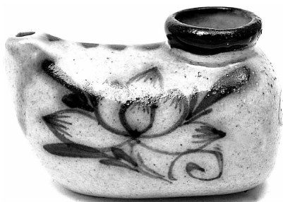
图 18 青花肖形油灯(陕西耀县)

意旨中充满着战胜客观困难的力量和自信。人们用“乡土艺术”来形容它的内在气质，也正是对那种来自劳动者生活的快乐情绪的赞美和概括。许多数百年甚至数千年前的“坛坛罐罐”，由于时代生活的变迁，今天虽已不再适用，却依然是人们