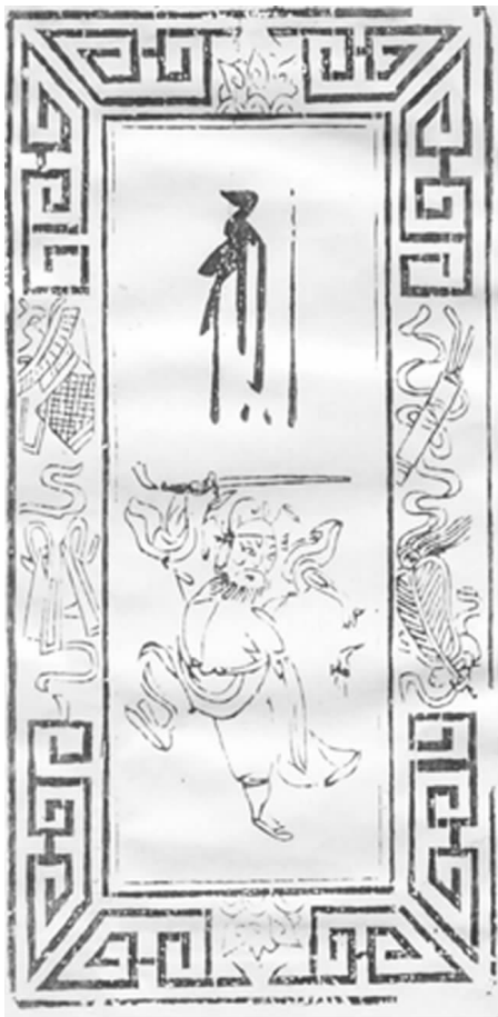
图 25 木版墨印 “钟馗驱邪”画符 (江苏如皋)

务,且多演出于各寺院的“善会”会场或崇奉佛教之家的寿筵丧典。演出的节目大都是宣传因果报应、劝善惩恶的宗教故事。相传观音菩萨曾化身影戏艺人,坐在蒲团上演唱,警世启顽,所以唱影戏的都要坐蒲团,以示严肃,而命名为“蒲团影”。及至道光、咸丰以后,宣扬佛教教义的状况才慢慢改变了。直到现在影戏中仍保留着许多佛教痕迹,如称剧本为“宝卷”,称照明油灯为“海灯”。另外,据有关专家考证,在清代咸