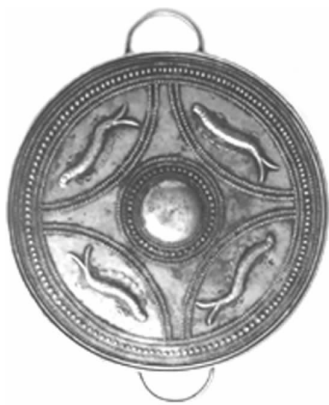
图 28 哈尼族银四鱼纹乳泡胸牌(云南)