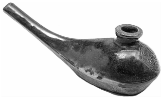
图 21 黑釉长嘴油灯(河南)

比较发达的国家或民族的文化领域里,那种跟一般处于高位的上层文化相对立的,处于下位的文化。两种文化汇合起来,才构成了整个国家或民族的文化,这就是我们今天所常说的民族传统文化。民间文化