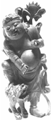
图 26 木雕“合和二仙”之一(江苏南京)

目前,由于各国学者对“民俗”一词认识不一,所以至今民俗学学科概念尚未完全一致。“民俗”一词在我国本来已沿用甚久。《礼记》中便有“礼从宜、事从俗”,俗,孔颖达解为“土俗”;《礼记·王制》中还有“命太师陈诗,以观民风”;《汉书·王吉传》中有“百里不同风,千里不同俗”;此后,“民风”、“习俗”、“风俗”等词在历史典籍中已成习惯用语。20世纪二三十年代,西方“Folklore”一词辗转流入我国之后,曾先后有土俗、谣俗、风俗、民风等译名,直到1927年广州中山大学《民俗》周刊创立,方以“民俗”、“民俗学”正式作为学术名词定称。民俗学在我国出现伊始,由于受欧洲学派的影响,曾经一度局限于民歌、民谣、民谚、民间传说等口头传承文学范围,历经几十年的发展才逐渐将领域拓展至全面的民俗文化事象的研究。目前,