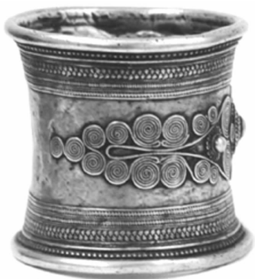
图 39 阿昌族银编丝手钏(云南)

从民间美术中借鉴美的形式，是现代艺术家提高修养和获取素材的重要途径。但在这种借鉴中，有一种往往只注意其形式结构的倾向，而忽略了对其内涵的考察与理解，因此出现了两种错误的认识：一是依据民间美术与西方现代派艺术在形式构成上的某些相似之处，而把两者等同起