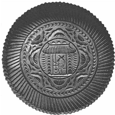
图 22 木刻饼模 (山西晋中)

究这项工作；（2）推动各方面大力宣传民族民间文化的价值和意义，宣传保护这种集体文化的必要性和迫切性，使文化界及一般人民对此都能理解和同感；（3）建议政府颁布广泛保护民间文化的法令，筹建各级有关的博物馆，使民间文化普遍地得到保护，进一步发挥社会教育的作用；（4）希望政府及某些社会文化团体用各种方式奖励在保护民间文化上做出贡献的集体和个人；（5）在高等院校及研究机关开展我国民间文化史和民间文化学的研究工作，并及时公布此类研究成果；（6）有条件的高等院校应开设关于民间文化的讲座，培养这方面的专业人才；（7）联系世界各国（特别是我们的邻近国家）同类的或性质相近的文化机关，以疏通信息，交流经验、成果，推进文化合作。他还说：“民间艺术在生活中有着不可替代的作用。它不但是民族艺术文化的重要组成部分，而且是构成民族文化的基石。忽视民间艺术，就不可能真正了解民族文化及其基本精神。”