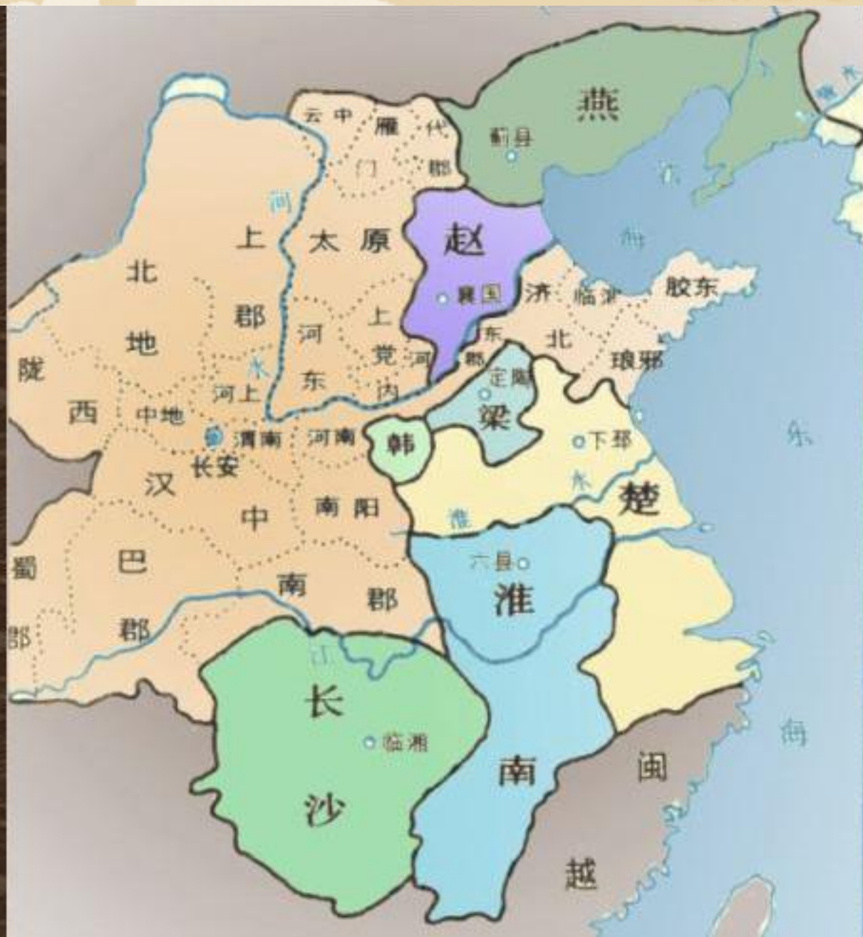
汉初异姓王形势图