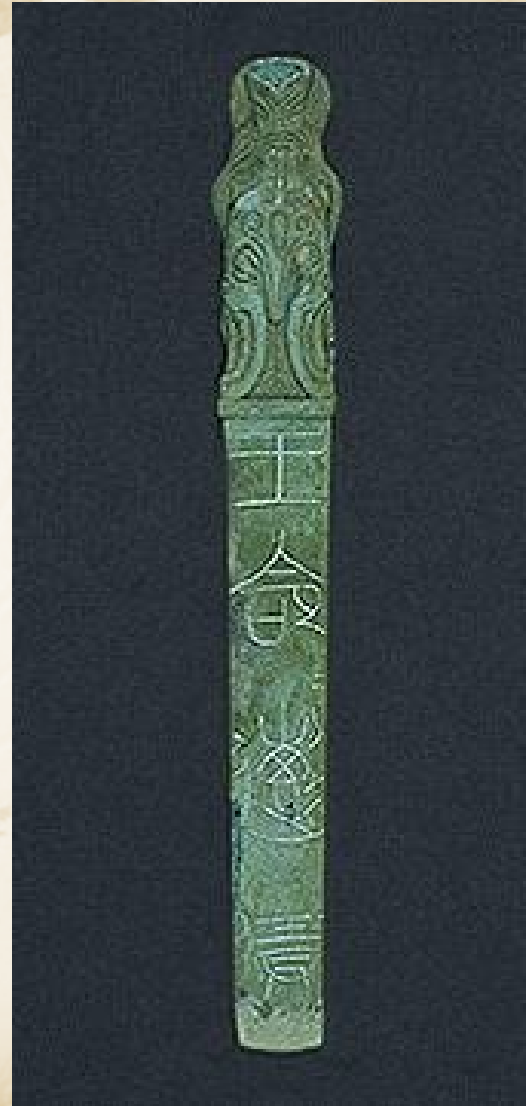
王命龙节（战国中晚期）