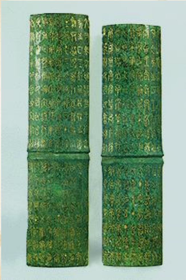
鄂君启节（战国中期）