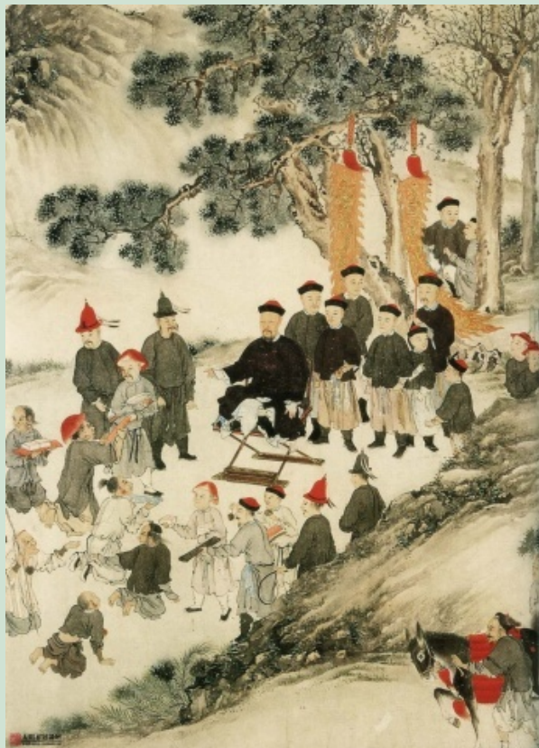
丕翁先生巡视台阳图 卷（局部）